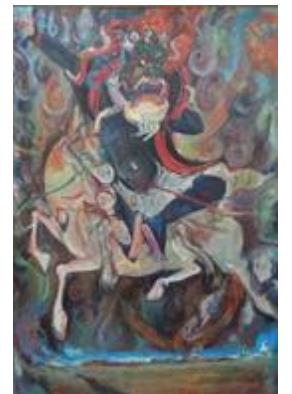
廣安芳子作 「チベット忿怒の女尊ペンデンラモ」

書庫入口近くで蔵書検索ができます。文化講座や絵画のテーマ、高野山の写真について等、もっと知りたいと思った方、この機会に蔵書検索(OPAC)を使ってみてはいかがでしょうか。